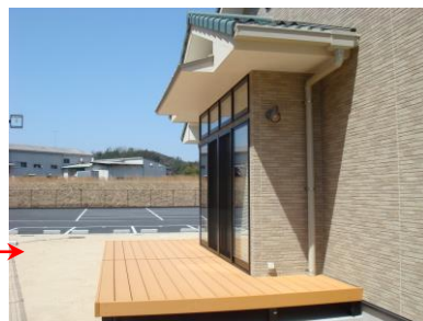
ケアホーム テラス